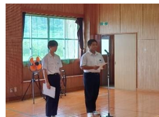
【選挙管理委員(3年生)】