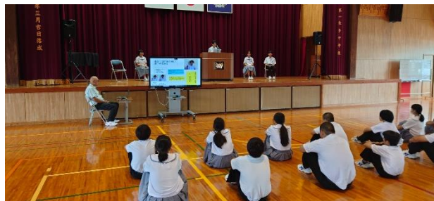
【立候補した生徒たち】