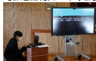
【生徒会についての説明】

4月9日(火)に生徒会主催で「新入生を迎える会」を行いました。生徒会役員を中心に、春休み前から準備に取りかかり、当日も朝・昼と進行や運営の打ち合わせをしていました。生徒会による寸劇「第一佐多中の一日」では、ユーモア溢れる劇を通して、分かりやすく中学校生活の様子等を紹介しました。また、部活動紹介では、日頃の練習の成果を新入生の前で披露してくれました。生徒会役員のみなさんも、部活動のみなさんも、確実に成長しているという姿を新入生に見せてくれました。