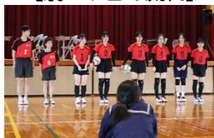
【部活動紹介 バレー部】