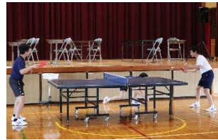
【部活動紹介 卓球部】