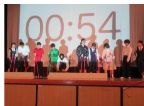
【1年劇「うらしまたろう」】