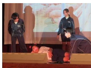
【2年劇「僕らの職場体験日誌」】