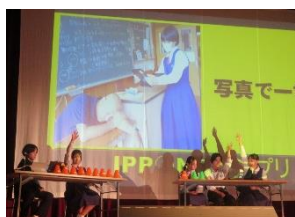
【生徒会オープニング】