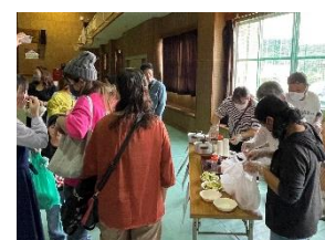
【家庭教育学級・クラフトコーラ試飲】

11月10日（日）に第33回文化祭を開催しました。今年は「青春劇場開幕! 光れ! 23人のそれぞれの物語」をテーマとし、一人一人が「文化祭の主役なんだ!」という気持ちで練習から本番まで取り組みました。各学年の劇では、宿泊学習や職場体験学習で学んだことをクイズやパワーポイントで説明を交えながら、分かりやすく発表してくれました。また、2つの有志団体も参加し、会場を盛り上げてくれました。展示作品も各教科で作成したものが数多く展示され、日頃の学習の成果を見ていただきました。お越しくださった保護者、地域の皆様の温かい拍手や声援が、生徒にとって大きな自信と励みにつながりました。本当にありがとうございました。