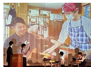
【3年劇「中学生活と進路」】