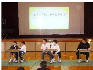
【全校レクリエーション】