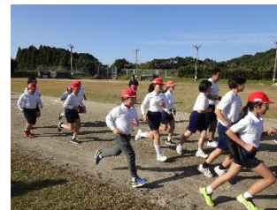
【ロードレース大会】