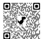
学校ブログ QR コード